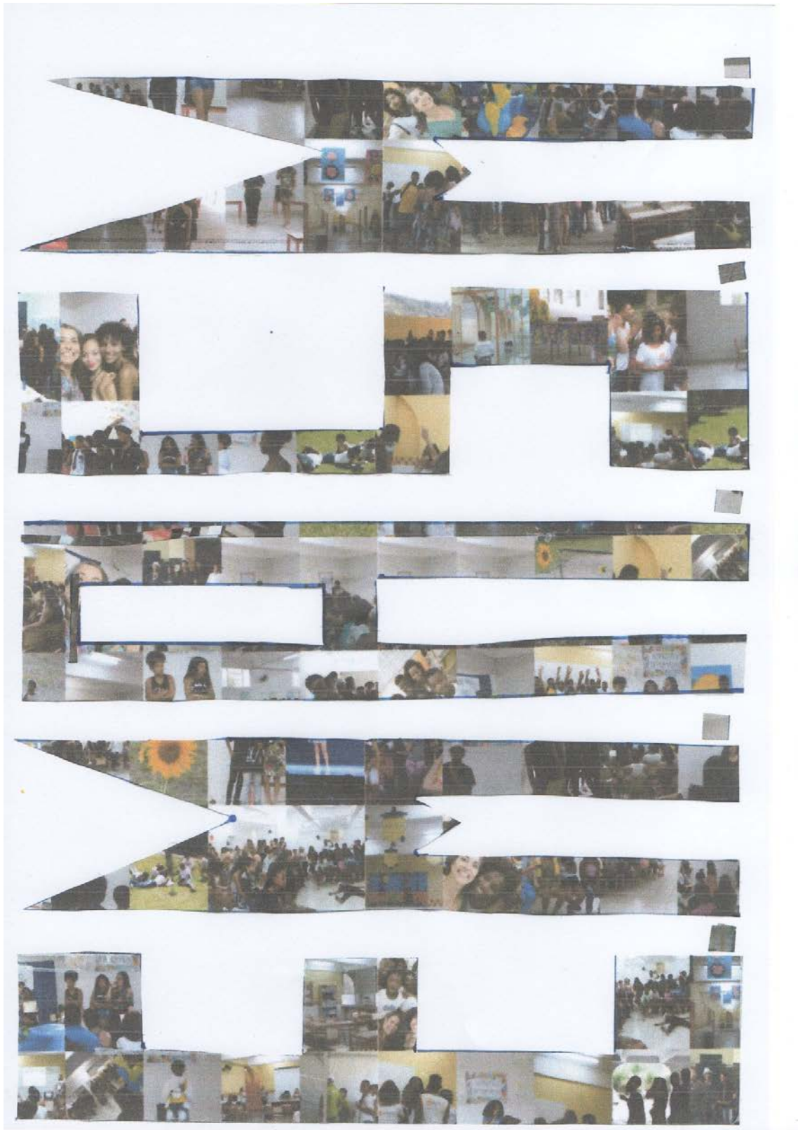
Figura 1 - Mosaico de fotos do acervo pessoal da autora