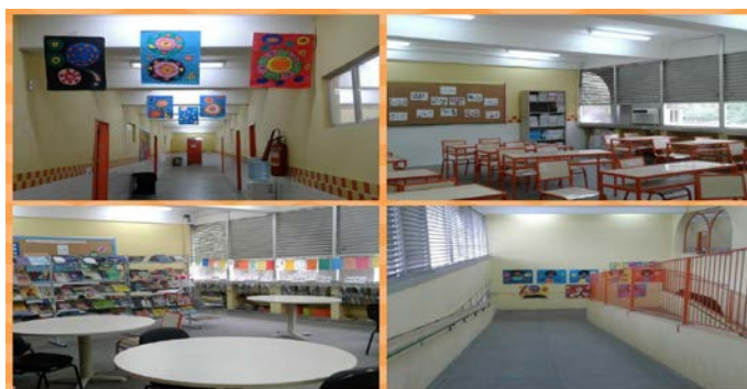
Figura 4 - Imagens da Escola Municipal Antinéia Silveira Miranda