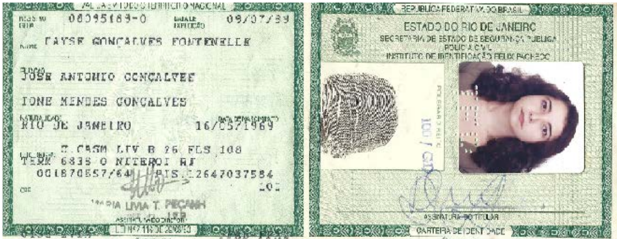
Figura 2 - Imagem da Carteira de Identidade da autora

À primeira vista, estou oficialmente definida. Tenho um nome e um sobrenome; um número de identificação oficial; a definição do meu estado civil e minha filiação. Sou de fato essa pessoa, mas será que sou só isso? Somos definidos e identificados, apenas, por nossos documentos oficiais? Será essa identificação o bastante?