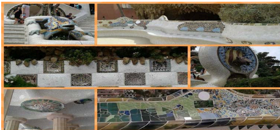
Figura 5 - Imagens do Park Guell, Barcelona