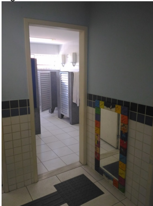
Figura 7 – Entrada do banheiro dos meninos