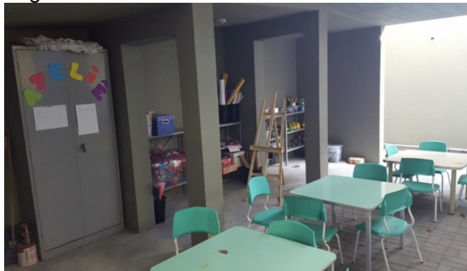
Figura 4 – Ateliê de arte