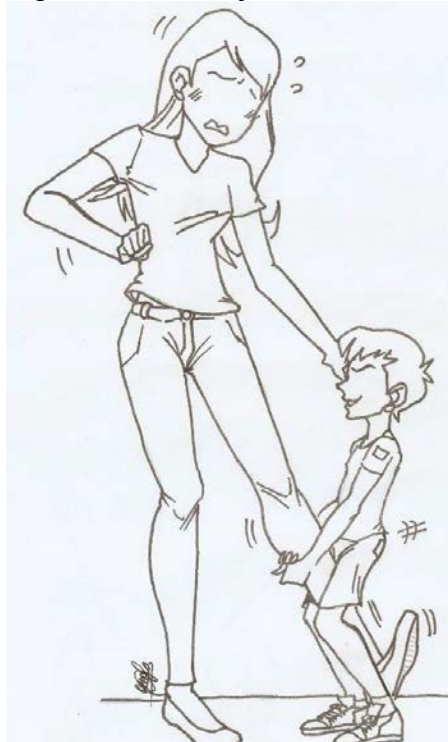
Figura 1 – Criança demonstrando sua sexualidade