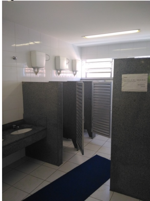
Figura 8 – Banheiro das meninas