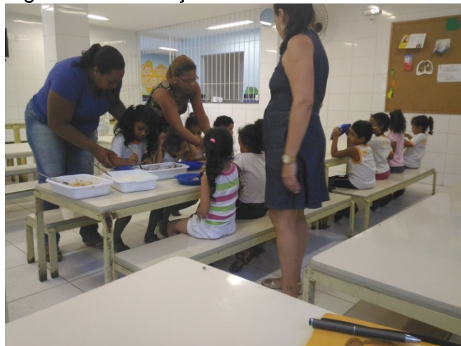
Figura 11 – Crianças se servindo no refeitório