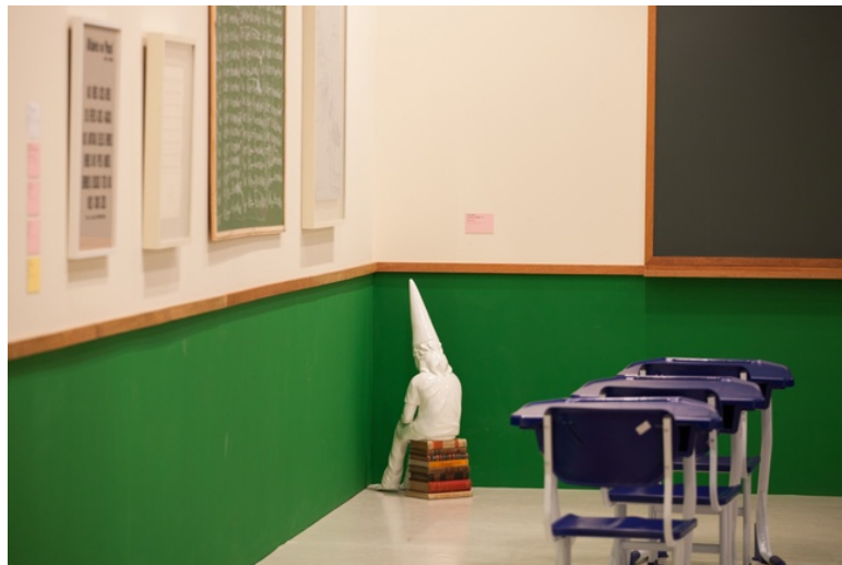
Figura 2 – Exposição “Há escolas que são Asas e há escolas que são Prisões”

Fonte: Museu de Arte do Rio – MAR. Out./2014 a Jan./2015. Fotografia de Flávio Cerqueira.