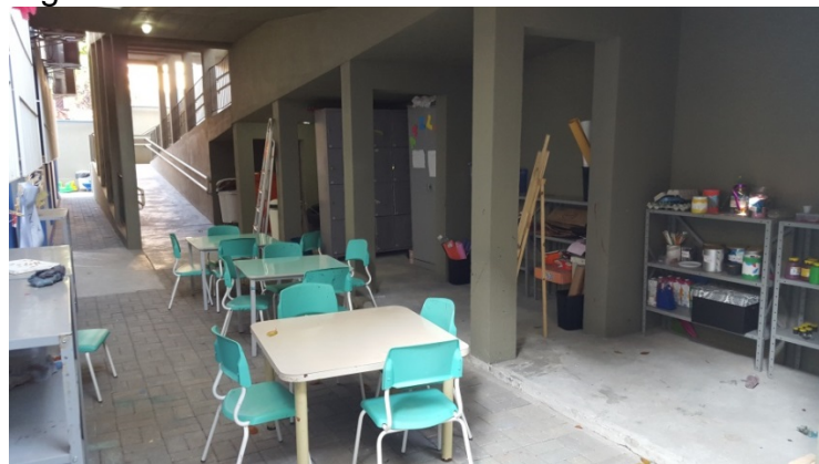
Figura 5 – Ateliê de arte