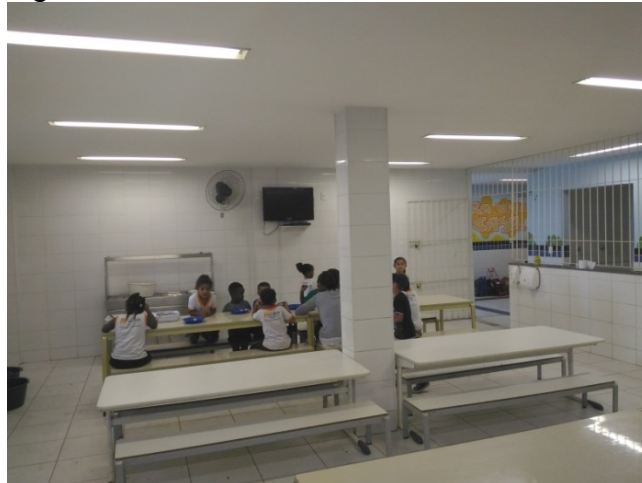
Figura 10 – Refeitório