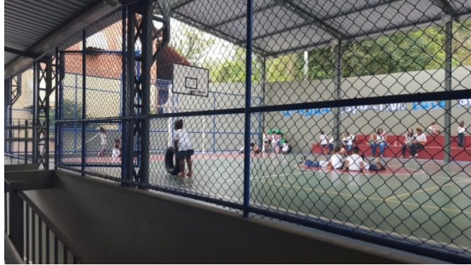
Figura 3 – Quadra poliesportiva