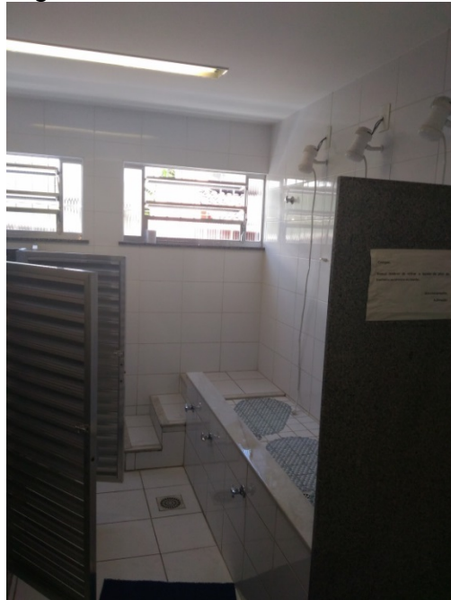
Figura 9 – Área de banho do banheiro dos meninos